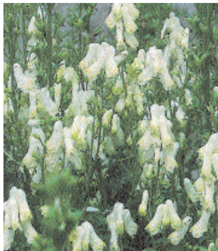
▲ Aconitum napellus 'Albus', navadna preobjeda, je poleti cvetoča preobjeda z belimi cvetovi. Zraste do 100 cm.